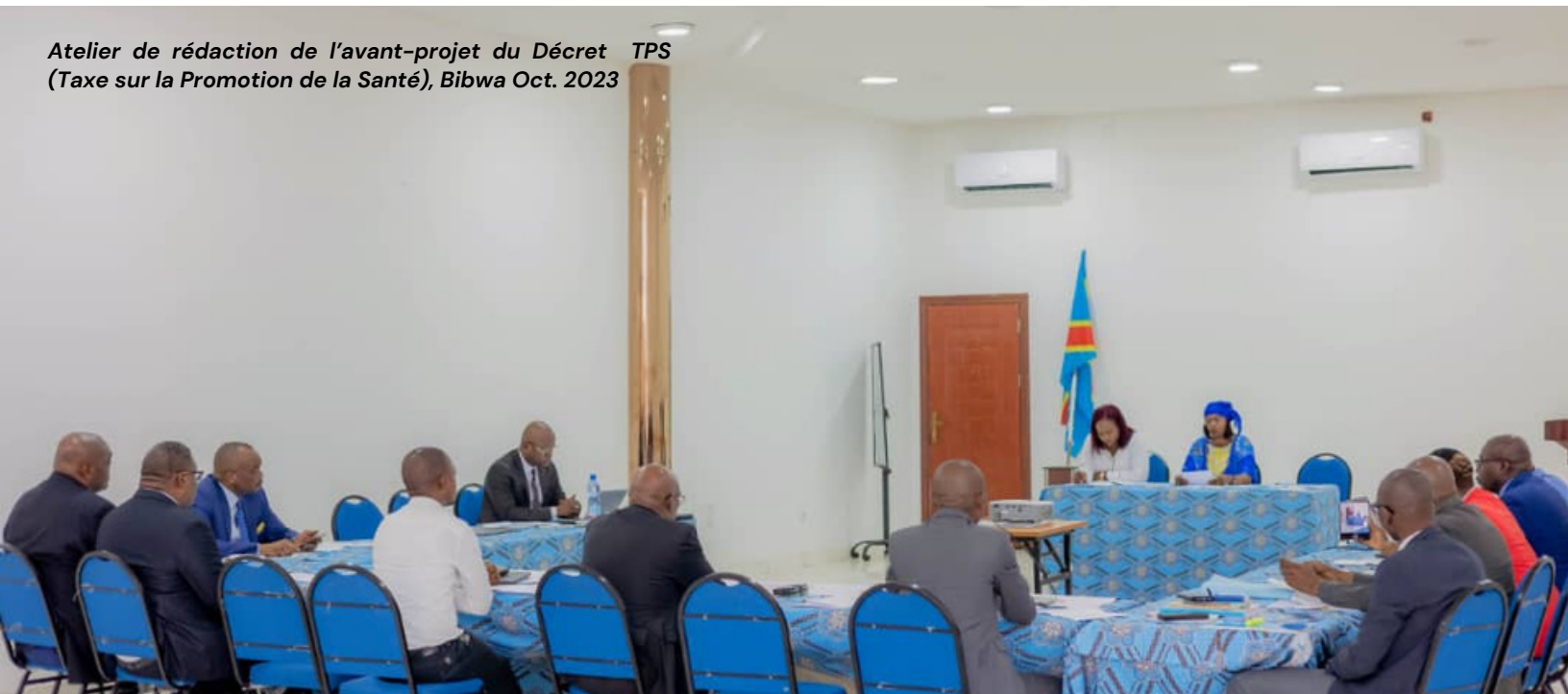
Atelier de rédaction de l'avant-projet du Décret TPS (Taxe sur la Promotion de la Santé), Bibwa Oct. 2023

Une cascade de réunions pour l'appropriation et la mise en œuvre de la couverture santé universelle et le démarrage effectif de la gratuité des accouchements et des soins du nouveau-né sous la conduite de SEM le Ministre de la Santé Publique, Hygiène et Prévention.